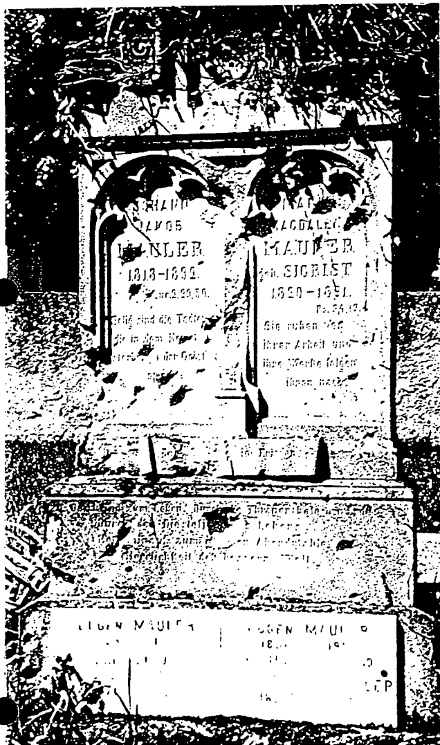
(M.122.11) p. 13