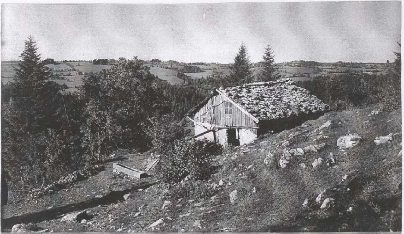
Vielle loge rière La Sombaille vers 1870