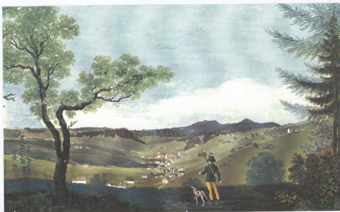
Le Locle vers 1795 par Henri Courvoisier-Voisin