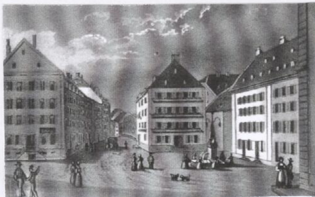
La Chaussée de Fendo